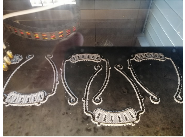
Plateau de 12 visières Visière en cours d'impression