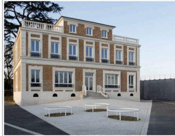
l'Observatoire (début XXIème siècle)