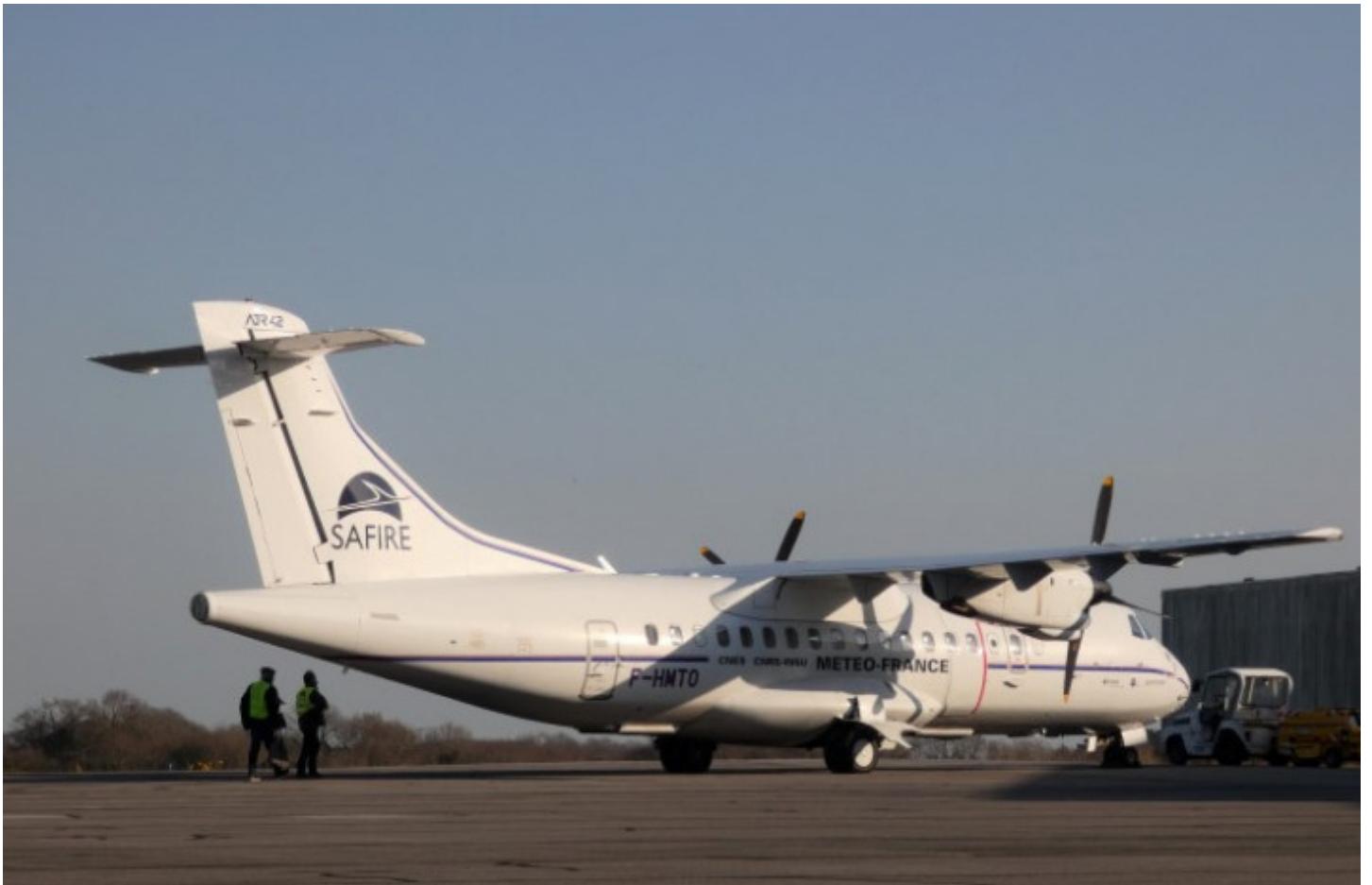
Avion ATR42 F-HMTO opéré par Safire, ici sur au parking de l'aéroport de Quimper