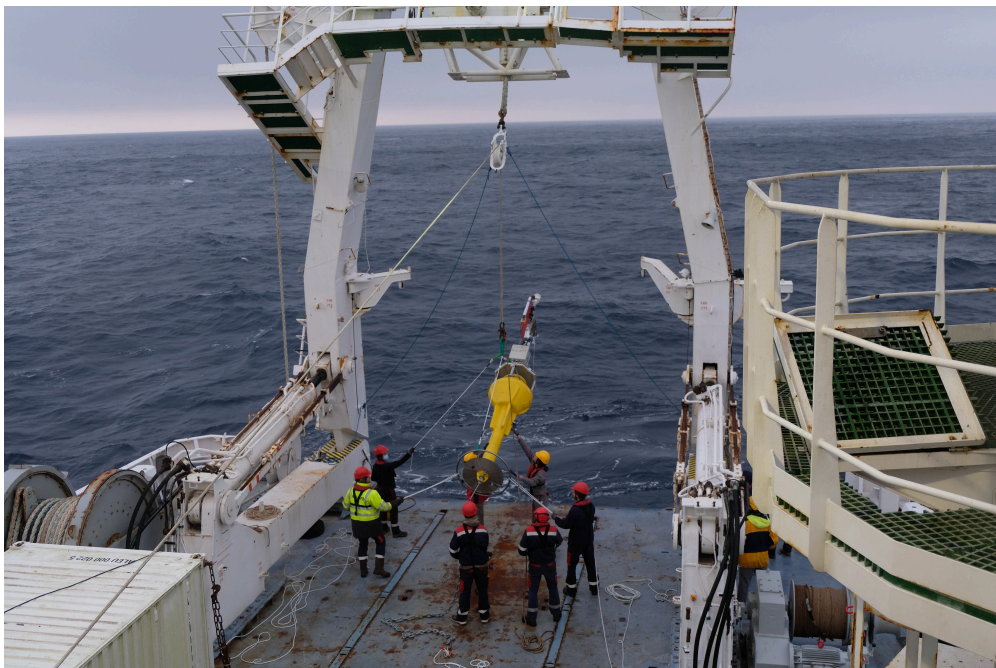
Mise à l'eau depuis le navire L'Atalante d'une bouée « FLAME » (mesures des flux turbulents de surface).