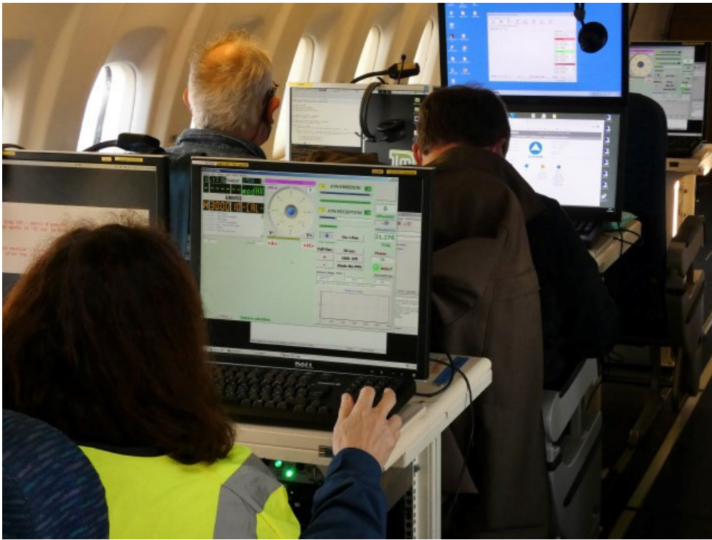
Poste de commande/contrôle du radar Kuros du Latmos à bord de l'avion ATR42 de Safire Image Safire