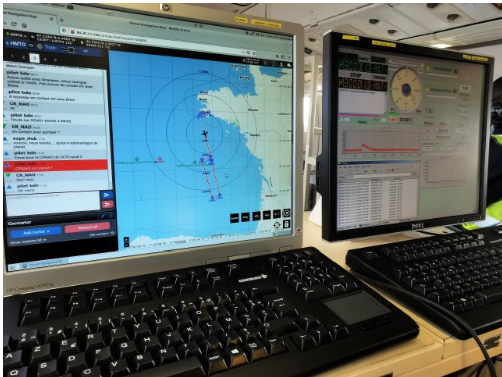
A droite : poste de commande/contrôle du radar Kuros du Latmos à bord de l'avion ATR42 de Safire ; à gauche poste de suivi des opérations en vol